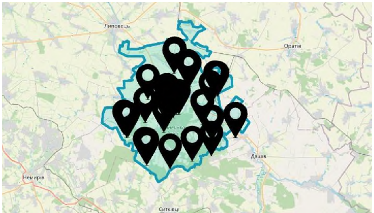
Рисунок 2.1. Карта Іллінецької громади.