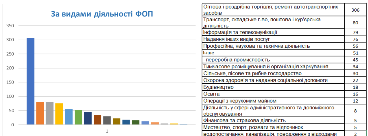
Рисунок 7.2 Розподіл фізичних осіб – підприємців за видами економічної діяльності

Сектор підприємництва Іллінецької громади представлений практично у всіх сферах економічної діяльності, станом на 01.01.2026 у громаді зареєстровано 845 ФОП . Найпоширенішими видами діяльності серед підприємців громади є оптова та роздрібна торгівля, ремонт автотранспортних засобів; інформація та телекомунікації; надання інших видів послуг.