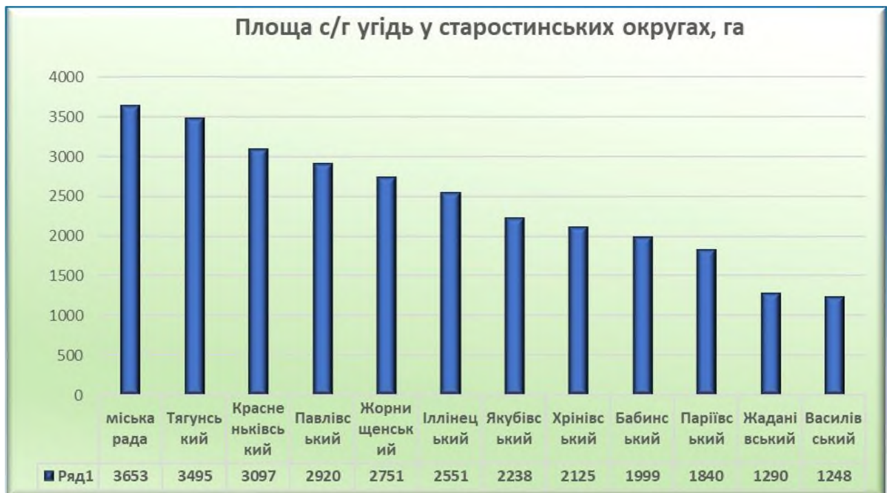
Рисунок 7.1 Площа с/г угідь у старостинських округах

Земельний фонд Іллінецької міської територіальної громади станом на 01.01.2026 загалом складає 47007 га , в тому числі площа населених пунктів – 5298 га , площа земель за межами населеного пункту - 41709 га .